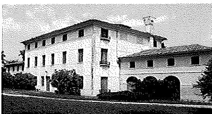
TAVOLO DI LAVORO SU VILLA BIANCHINI

Inizio lavori ore 18.30 Conclusione prevista ore 20.00