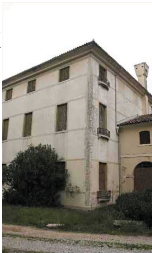
MIRANO Villa Bianchini a Zianigo